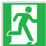
E002 Rettungsweg/Notausgang (rechts)