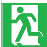
E001 Rettungsweg/Notausgang (links)