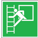
E016 Notausstieg mit Fluchtleiter

Kennzeichnung von Notausstiegen, bei denen eine Flucht ohne Hilfsmittel möglich ist